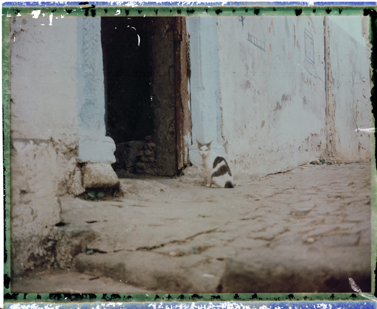
Un chat de la Casbah