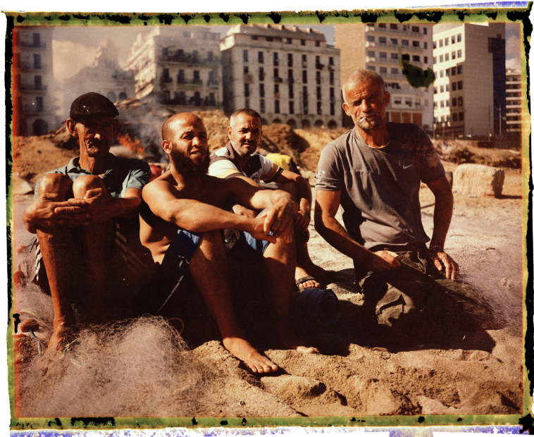
Des pêcheurs sur la plage