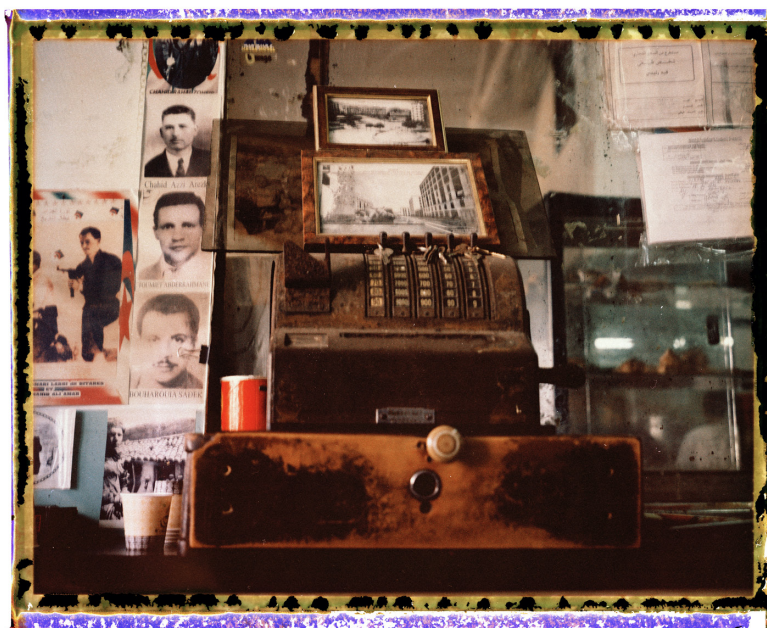
Une caisse enregistreuse

Images Plurielles tâche de redonner vie à la mémoire des Hommes et des lieux, de porter un autre regard sur le monde et de constituer l'identité d'un engagement fort, celui du rapprochement entre les êtres humains. Depuis sa création, la maison multiplie les actions de proximité, au niveau local, régional ou national, afin de faire découvrir la photographie au plus grand nombre, à travers des ouvrages photographiques, expositions, coffrets et actions en faveur de divers publics, qu'ils soient éloignés ou proches du processus de création photographique. Images Plurielles met l'accent sur la promotion et la diffusion de photographes émergents, et favorise la rencontre d'artistes et intellectuels venus de différents horizons afin de susciter l'échange, le dialogue et de mettre en place un réseau de partenaires pluridisciplinaires, en France et dans le monde.