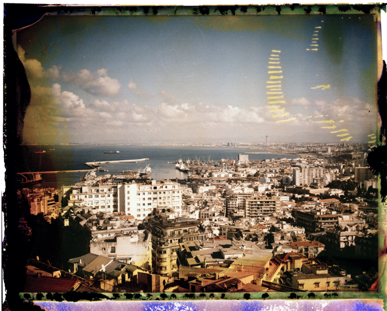
La Baie d'Alger

Photos d'Abed Abidat Préface de Samir Toumi 23 x 24 cm 120 pages 66 photos en quadrichromie Prix public 25 € ISBN : 978-2-919436-23-1